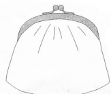
付属の型紙でできるバッグの形

Lastly, cover the frame with a piece of scrap cloth, and using a plier, pinch four sides of the frame to keep the paper strings and fabrics in. Let everything dry and you are done!